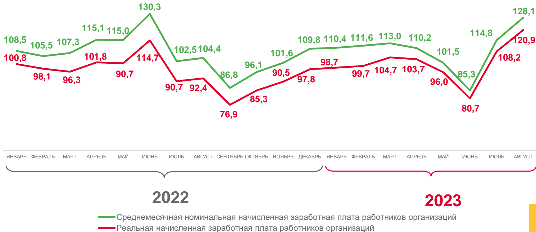
Динамика среднемесячной начисленной заработной платы работников организаций, в % к соответствующему месяцу предыдущего года